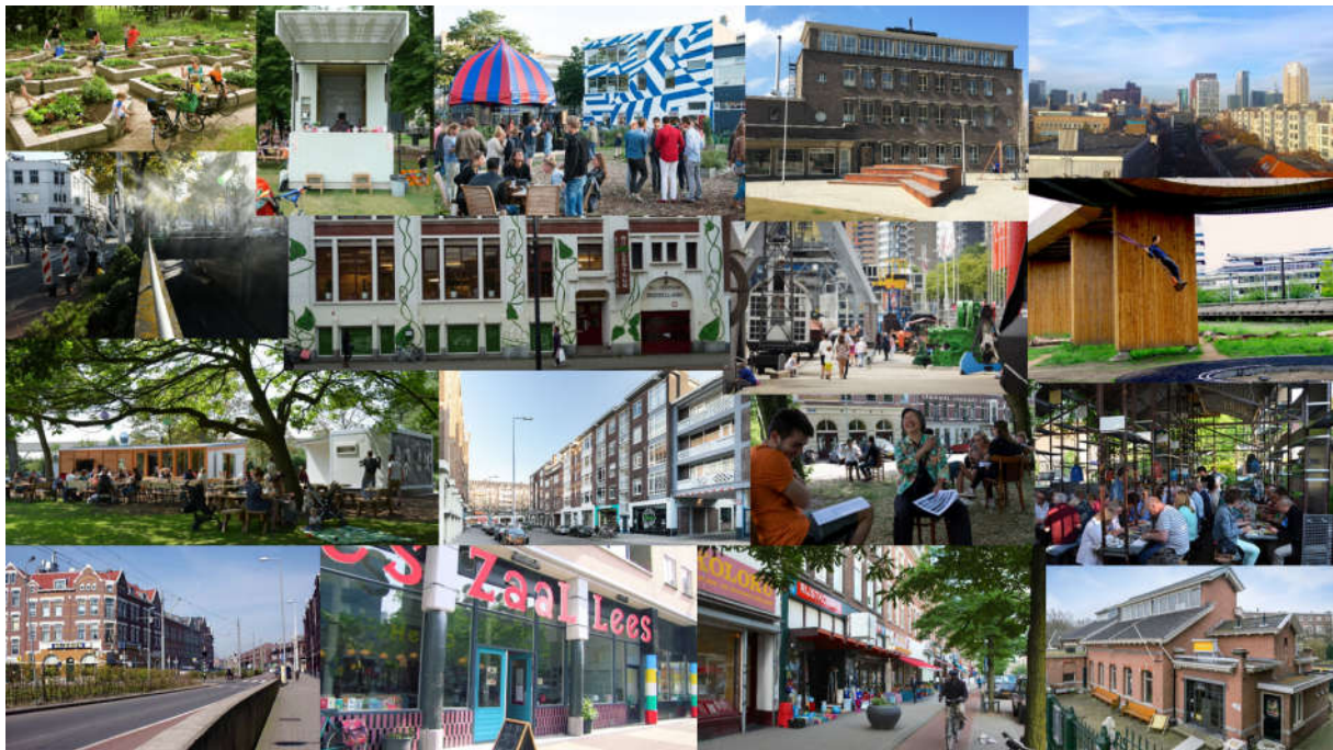
Figuur 1: Akkoorden en muziekstukken uit de Rotterdamse stadmakers praktijk

vanuit min of meer toeval en spontaniteit interacties en creatieve processen met elkaar aangaan. Uit de combinatie van kleine ongenoegens (bijvoorbeeld een ongebruikte of verwaarloosde plek of behoefte in de stad) met een grootst plezier (zoals het samenwerken aan creatieve oplossingen), zo omschreef Deleuze, ontstaan nieuwe akkoorden, kleine en grootse muziekstukken van initiatief en levendigheid 1 .